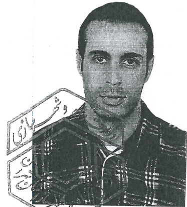
رشته موضوع پروانه